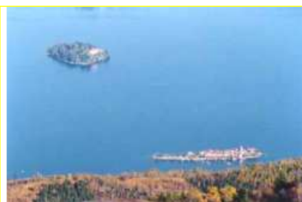
Panorama del lago Maggiore dal Mottarone.